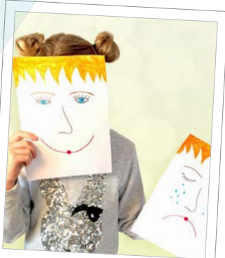
Die Seele stärken

„Einfach bewegend“ ist eine Aktion für Schulen, um in Bewegung zu kommen - ob in Sport-, Wander- oder Winterschuhen - und dabei einfach Spaß zu haben. Zeitlich sowie örtlich flexibel und unabhängig von der Jahreszeit. Indem wir uns gemeinsam für die psychische Gesundheit von Kindern und Jugendlichen einsetzen und uns bewusst werden, dass das körperliche und seelische Wohlbefinden eng zusammenhängen, können wir mehr bewirken! Uns ist es wichtig, dass die Schüler*innen wissen, wofür sie sich einsetzen: