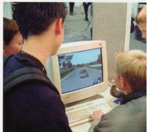
Jugendliche, vor allem Burschen, verbringen oft Stunden vor dem PC. Ob es zum Problem wird, hängt von vielen Faktoren ab.